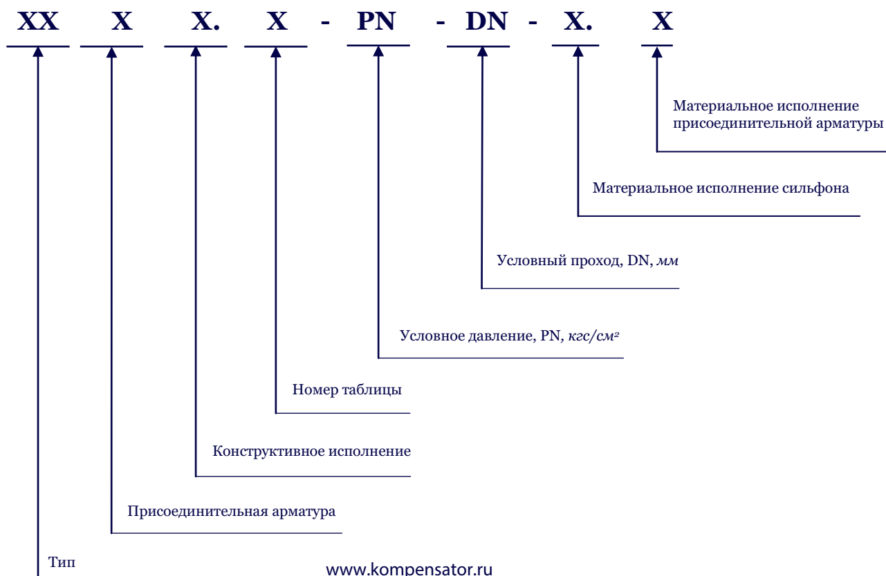
Схема условных обозначений компенсаторов